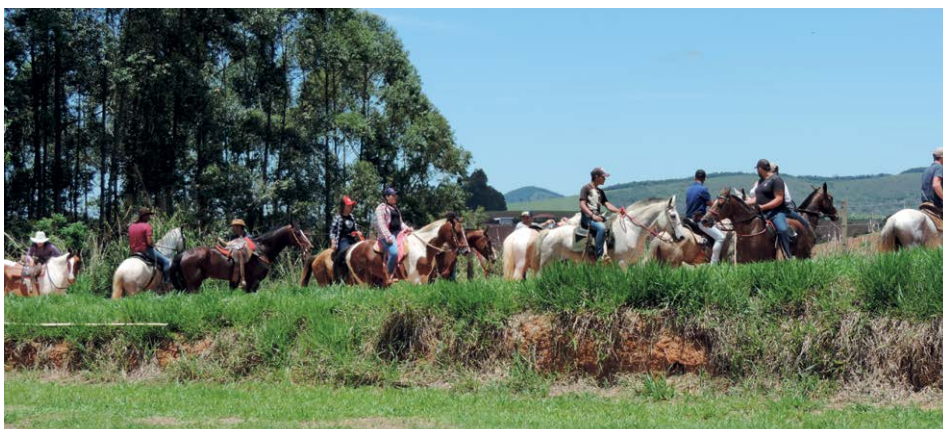
Participantes realizaram cavalgada