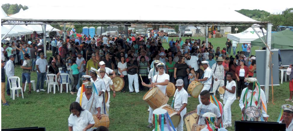
Atrações culturais também movimentaram o torneio