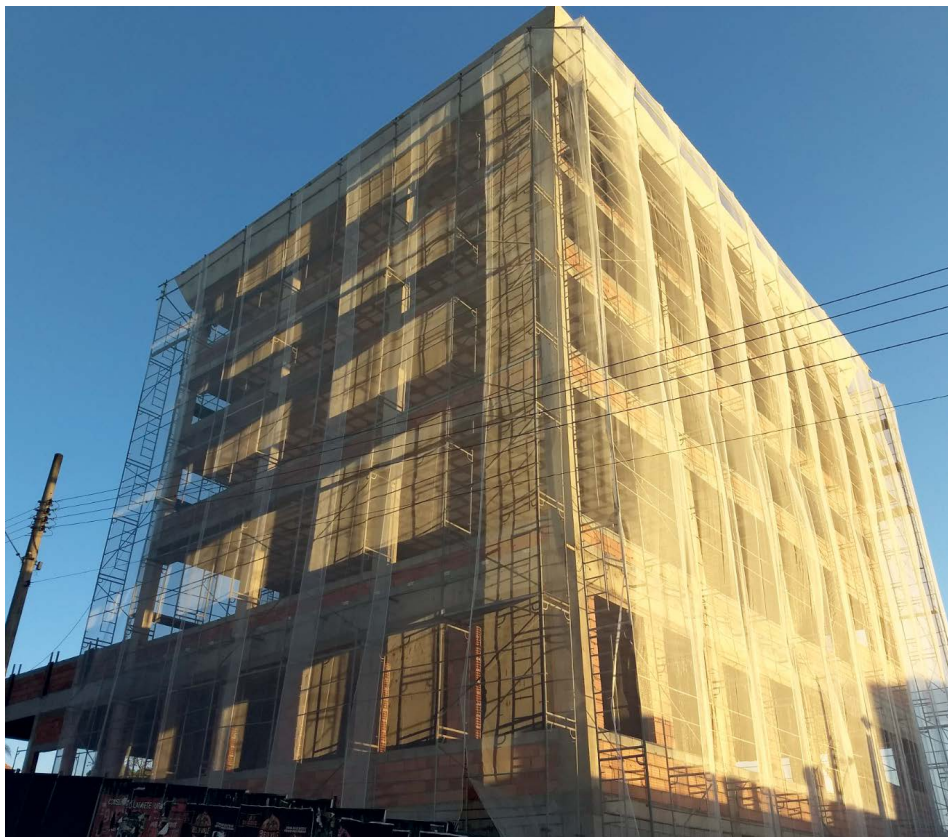
Obras em curso para a entrega da agência e da fachada do prédio

“O acabamento dos andares superiores, onde será instalado o CAD, será executado aos poucos, num cronograma responsável, sem comprometer os índices de imobilização da Credicampo”, frisa Saulo.