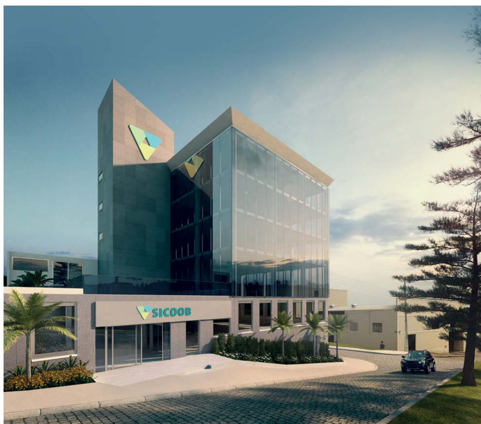
Projeção arquitetônica de como ficarão a agência e o Centro Administrativo