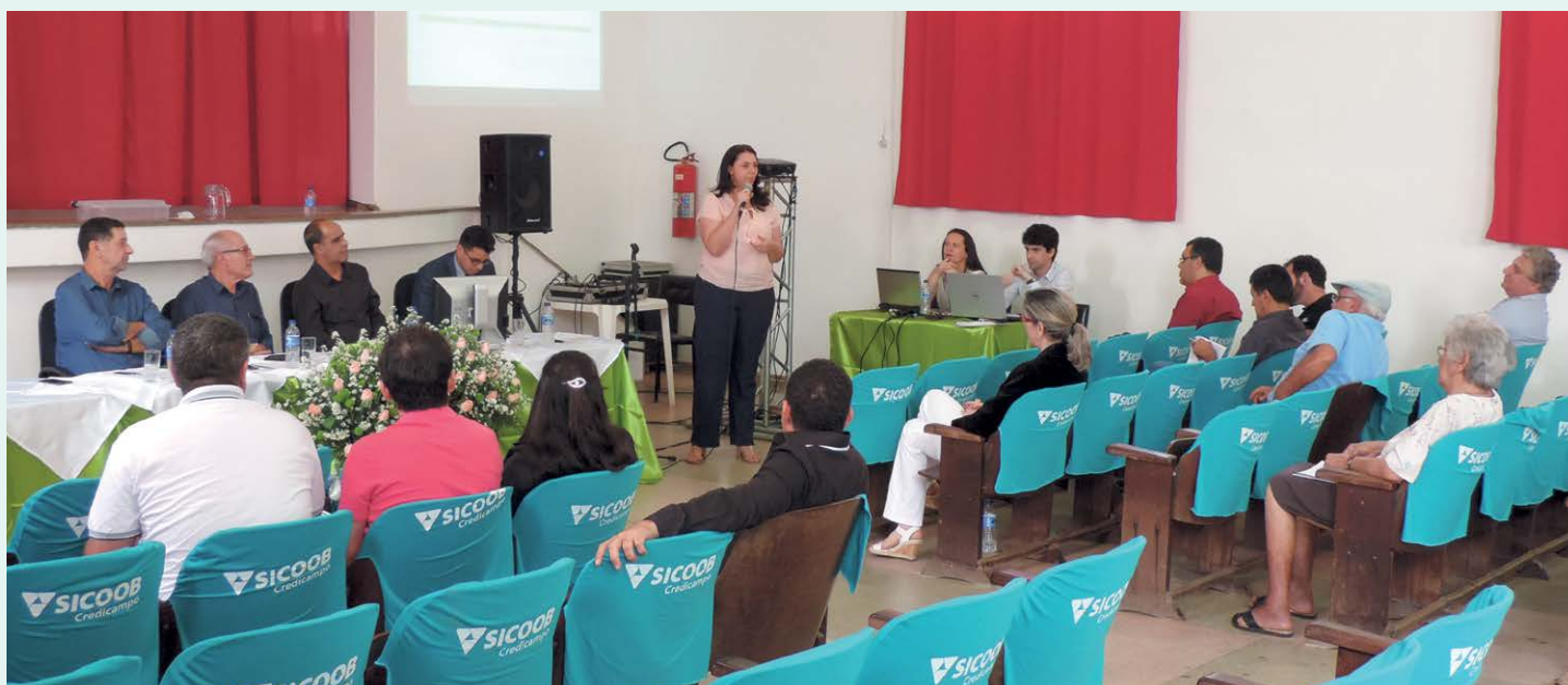
Assimbleia Geral Extraordinária, ocorrida em outubro, debateu mudanças na gestão da cooperativa

perativas de créditos a captarem recursos de municípios, de seus órgãos ou entidades e de empresas por eles controladas. A novidade tornou necessária a criação de dispositivo estatutário que permita à cooperativa executar esse tipo de operação. Com essa mudança, a cooperativa passa a poder realizar movimentações de verbas municipais, continuando, no entanto, impedida de fazer operações de crédito para prefeituras.