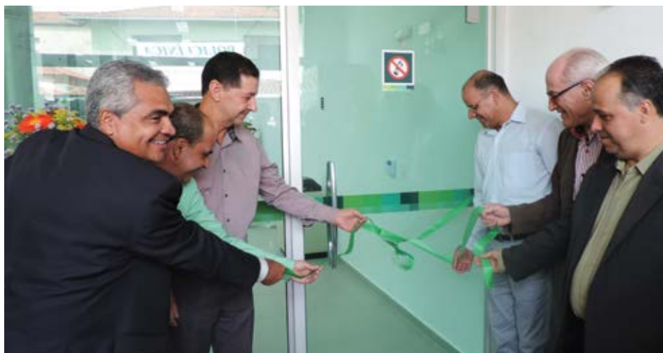
Autoridades inauguram a nova agência