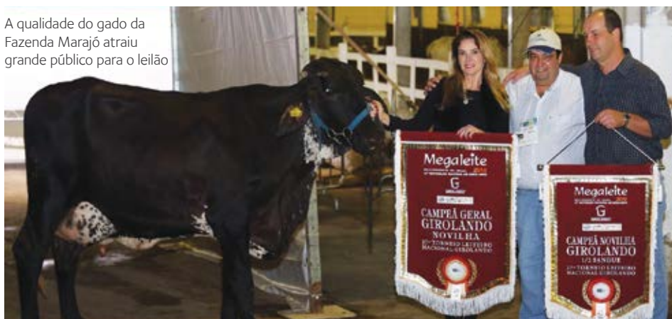
A qualidade do gado da Fazenda Marajó atraiu grande público para o leilão

A Fazenda Marajó acabou de conquistar o título de campeã nacional do torneio leiteiro, na categoria Novilha \frac{1}{2} sangue, durante a Exposição Nacional do Gado Girolando, Megaleite, em Belo Horizonte. Ela ainda estabeleceu um novo recorde nacional de produção, com o animal Solar, do Engenho Bélgica, que produziu, no pico, 93 kg de leite. Já com o animal Liberdade