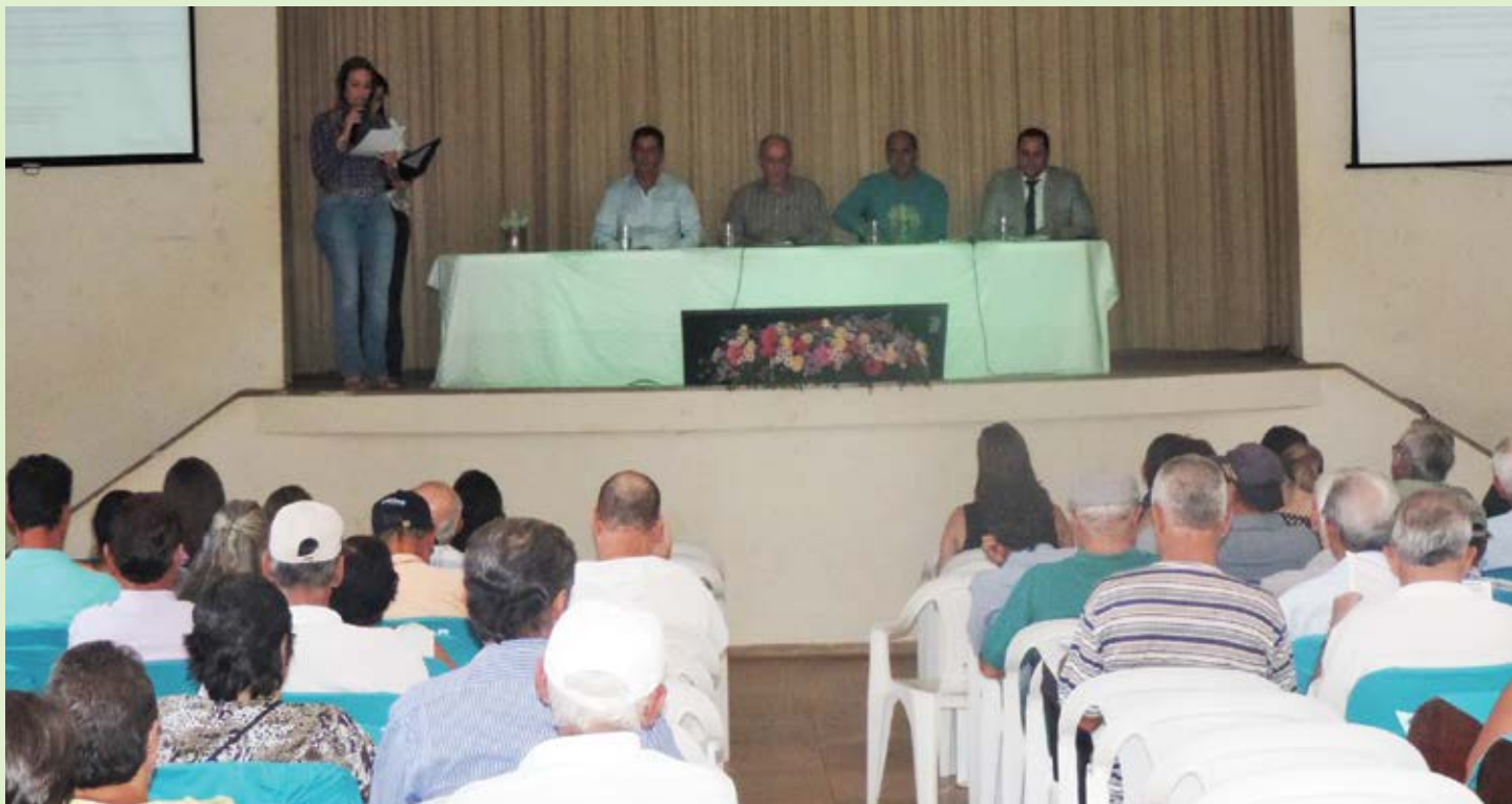
Resultados do Sicoob Credicampo foram apresentados durante a AGO

Os associados que participaram da primeira Assembleia Geral Ordinária (AGO) da cooperativa, em 15 de setembro de 1985, foram homenageados durante a AGO 2016, realizada em 15 de abril, no auditório Nossa Senhora das Brotas, em Entre Rios de Minas. Eles foram agraciados com um certificado de associado fundador, fixado em uma moldura, uma lembrança por apoiarem e fazerem parte da cooperativa durante essas três décadas.