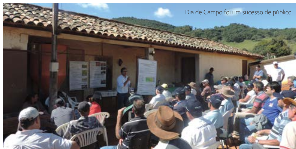
Dia de Campo foi um sucesso de público

Nutrição animal, gerenciamento de propriedades, formação de pastagem e mineralização do rebanho. Esses foram os temas abordados durante o Dia de Campo, promovido pela Empresa de Assistência Técnica e Extensão Rural do Estado de Minas Gerais (Emater-MG), na Fazenda Barreiro, na Serra do Camapuã, em junho. O encontro contou com a pre-