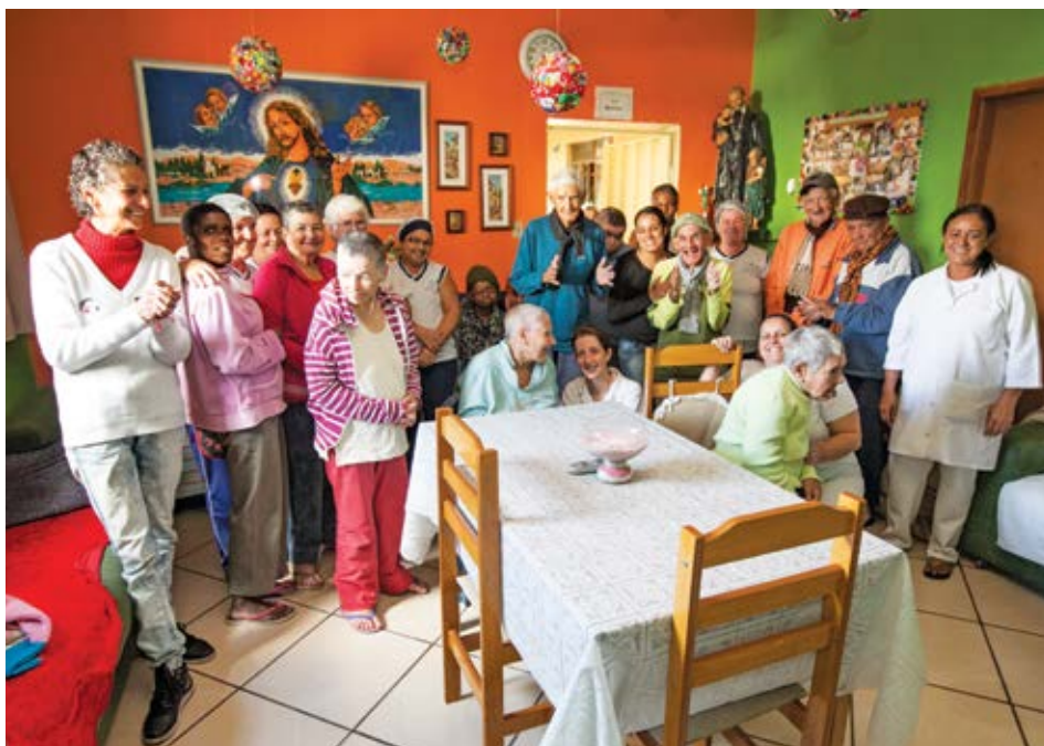
No asilo Dona Alzira Ribeiro, os 27 idosos são acolhidos com muito carinho