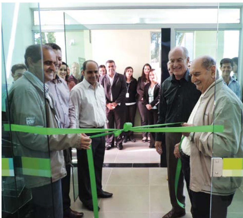
Inauguração da agência em São Brás do Suaçuí, mais espaçosa e com infraestrutura completa

Em 30 anos de operação, o Sicoob Credicampo já conta com mais de 10 mil associados, atendidos em oito agências espalhadas por Minas Gerais. Mas o sucesso, comprovado por esses números, só pode ser alcançado por meio do investimento constante na qualidade dos atendimentos e dos serviços oferecidos. Como prova dessa atenção, a cooperativa apresenta a nova agência de São Brás do Suaçuí, anuncia a construção da sede própria da agência de Entre Rios de Minas e a abertura de uma agência em Belo Vale. O objetivo desses investimentos é garantir locais mais confortáveis, modernos e seguros, bem como permitir que outras pessoas desfrutem das vantagens proporcionadas pelo cooperativismo de crédito.