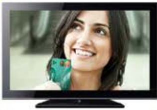
SMART TV 40"