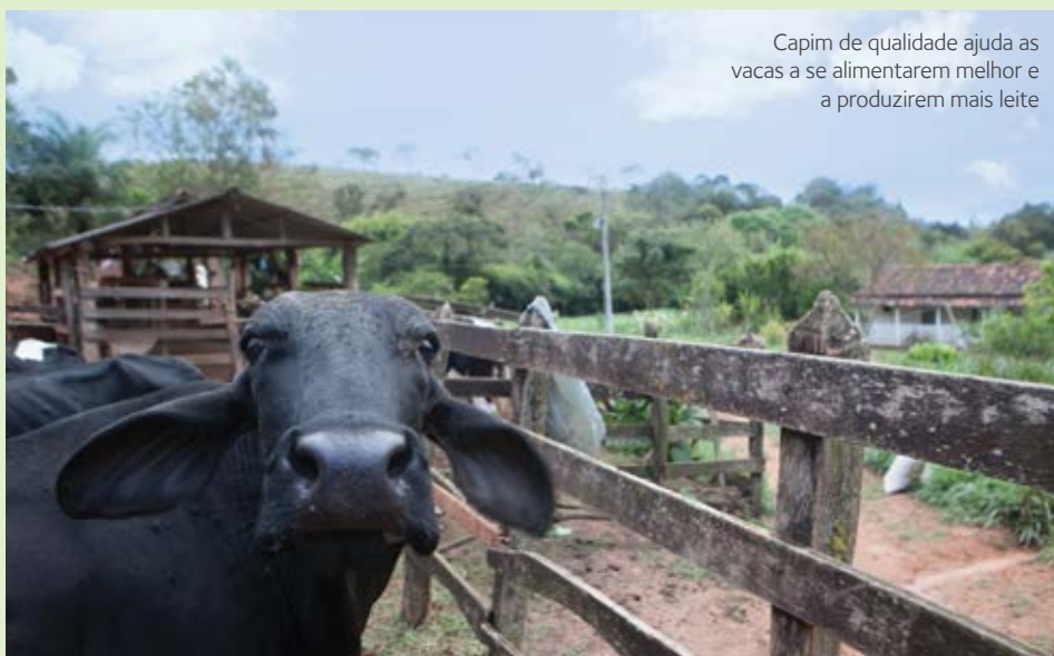
Capim de qualidade ajuda as vacas a se alimentarem melhor e a produzirem mais leite