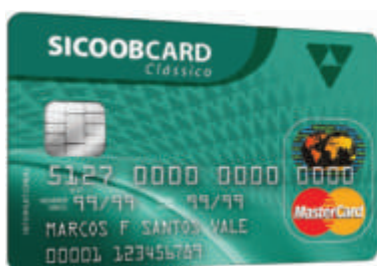
Sicoobcard MasterCard Clássico

Os cartões Sicoobcard são modernos, completos e cheios de vantagens para o associado. Um deles combina com você.