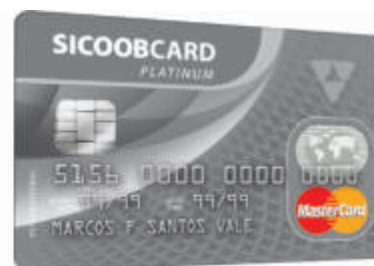
Sicoobcard MasterCard Platinum

Anuidade: R$ 84,00 (bônus de 100% após R$35.000 em compras no ano)