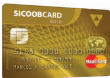
Sicoobcard MasterCard Gold

Anuidade: R$ 48,00 (bônus de 100% após R$5.000 em compras no ano)