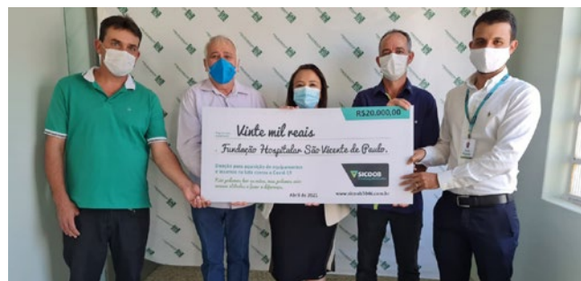
Hospital Municipal São Vicente de Paulo (Capelinha) – R$ 20.000,00