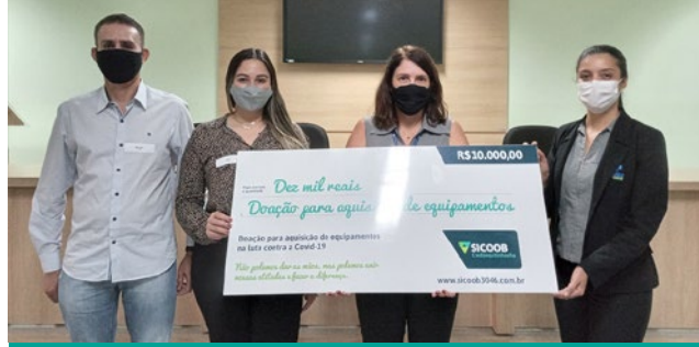
Hospital Nossa Senhora da Saúde (Diamantina) – R$ 10.000,00