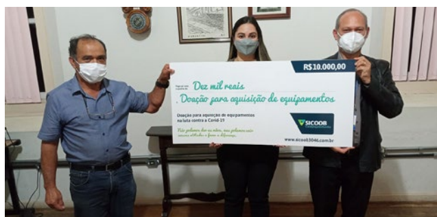
Santa Casa de Caridade de Diamantina – R$ 10.000,00