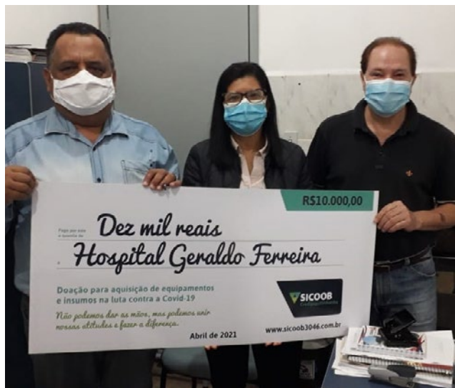
Hospital Geraldo Ferreira Gandra (Itamarandiba) – R$ 10.000,00

A doação foi articulada pela Diretoria Executiva e Conselhos de Administração e Fiscal, tendo a importante participação dos delegados, representantes dos associados da Cooperativa.