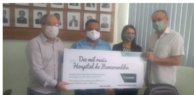
Hospital de Itamarandiba – R$ 10.000,00