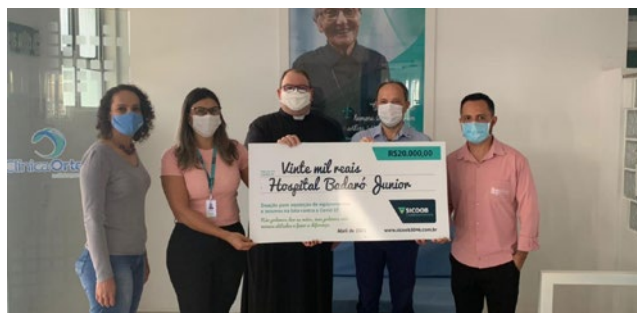
Hospital Doutor Badaró Júnior (Minas Novas) – R$ 20.000,00