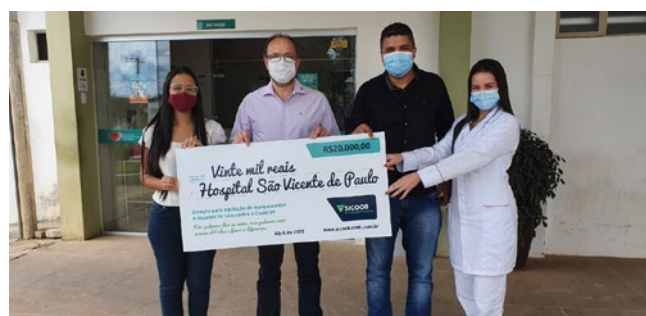
Hospital São Vicente de Paula (Turmalina) – R$ 20.000,00