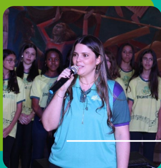
Bethânia Professora de Canto Coral