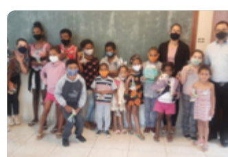
São João Nepomuceno