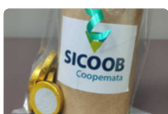
Juiz de Fora e Benfica