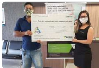
Casa do Peixe Contagem