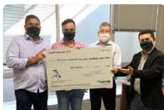
Coopmetro 4 Belo Horizonte