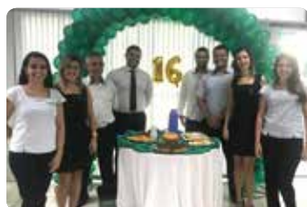
Equipe PA de Muriaé

Nesse primeiro trimestre de 2019, nossos Postos de Atendimento de Conselheiro Lafaiete, Juiz de Fora e Muriaé completaram mais um ano de funcionamento e de muito sucesso. No dia 13 de fevereiro foi comemorado o aniversário de 2 anos do PA de Conselheiro Lafaiete. Já no dia 18 de fevereiro, o PA de Juiz de Fora completou 6 anos com um delicioso café para os cooperados que passaram por lá no dia. O PA de Muriaé comemorou a marca de 16 anos de sucesso. Por lá também teve comemoração com os cooperados e um café cheio de delicias.