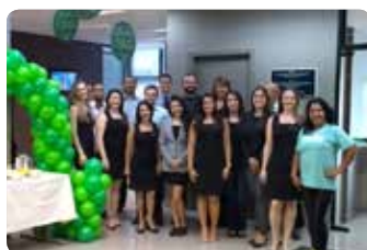
Equipe PA de Juiz de Fora