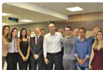
Equipe PA de Contagem

Agradecemos a todos que estiveram presentes nesse importante momento para a cooperativa. Esperamos contar com vocês sempre. ▼