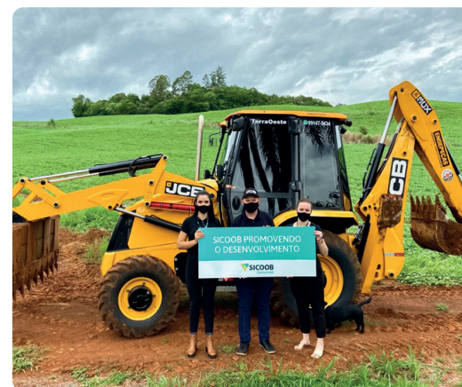
Evandro Reis, de Descanso/SC - Realizou um investimento com o Sicoob e adquiriu uma máquina retroescavadeira.