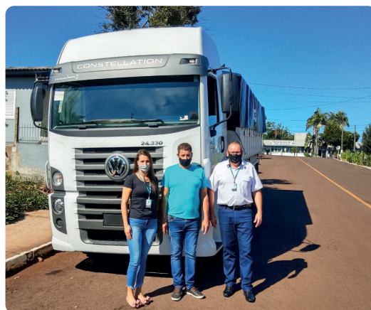
Neocir de Nadal de Caibi/SC – Utilizou as linhas de financiamento com recursos próprios do Sicoob para investir na frota de caminhões.