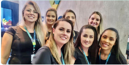
Facibel Belmonte/SC 6 à 8 de janeiro