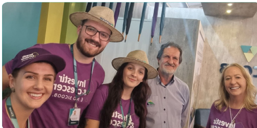
Festa da Fruta Mondai/SC 08 à 11 de junho