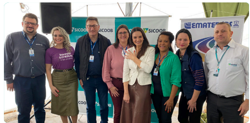
Carijo da Canção Gaúcha Palmeira das Missões/RS 25 à 27 de maio