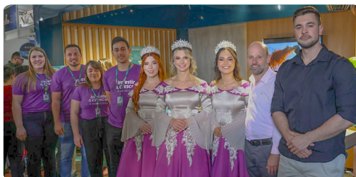
Expofesa Santo Augusto/RS 3 à 5 de novembro