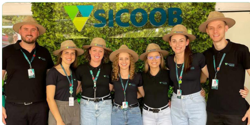
ExpoAgro Santo Cristo/RS 13 à 16 de abril