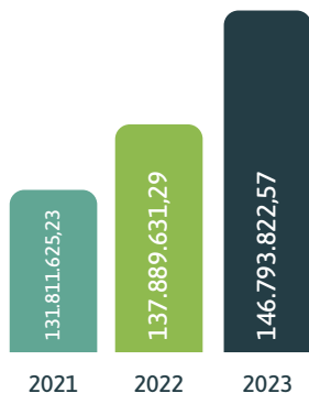
Depósitos à Vista