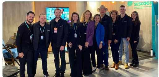
Faic Iporã do Oeste/SC 07 à 10 de setembro