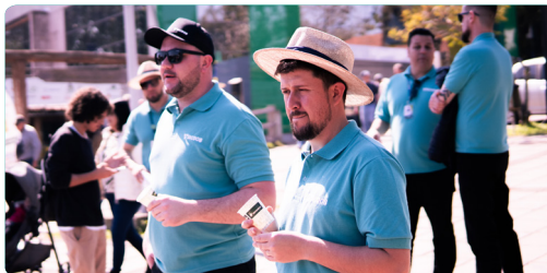
Expointer Esteio/RS 26 de agosto à 3 de setembro