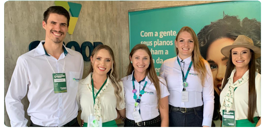
Expo Giruá e Feira do Butiá Giruá/RS 1 à 5 de março