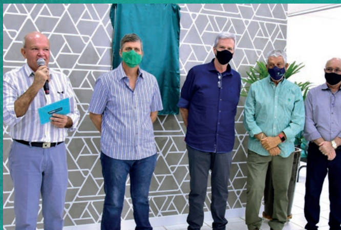
O Presidente Newton Durães Teixeira discursa na cerimônia em São José do Rio Preto.