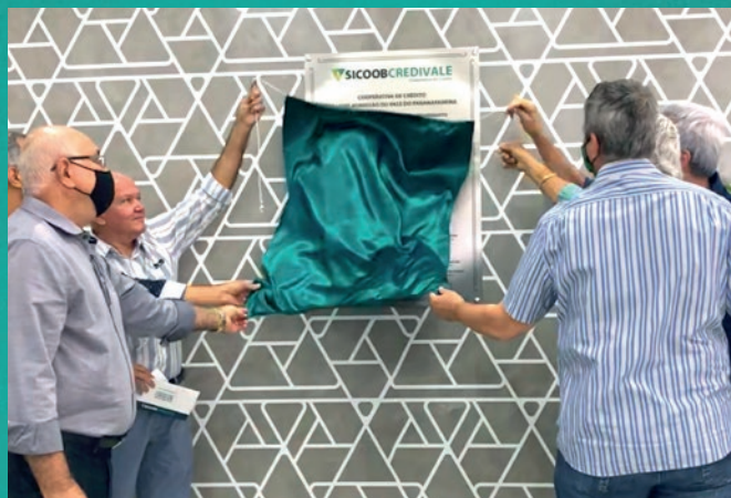
Diretoria durante descerramento da placa de inauguração em São José do Rio Preto.

comparação com as instituições financeiras tradicionais: na cooperativa, cada associado é coproprietário da organização e, nessa condição, tem acesso a um vasto portfólio de produtos e serviços bancários em condições mais vantajosas. Estas incluem economia em juros e tarifas, participação nos resultados e atendimento