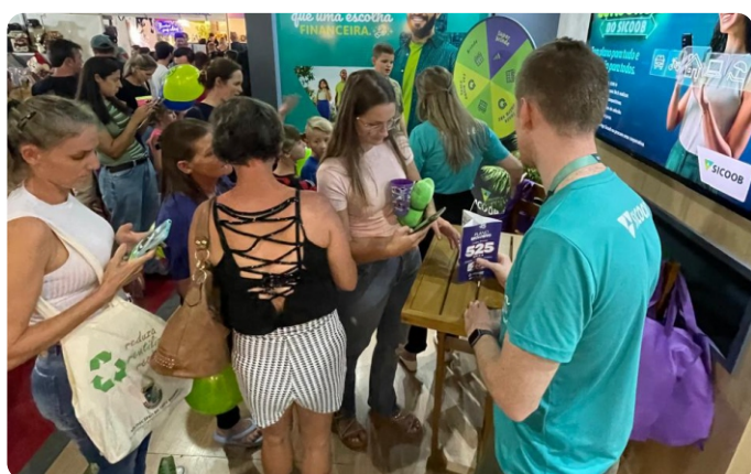
17ª FEICAP Três Passos/RS