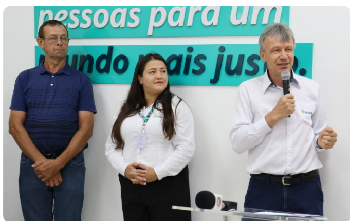
Inauguração da nova agência no Bairro Santa Tereza.