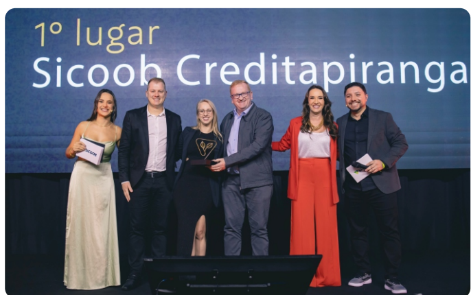
Recebemos o Troféu Sinergia – Cooperativismo – na Campanha Regional de Investimento Social