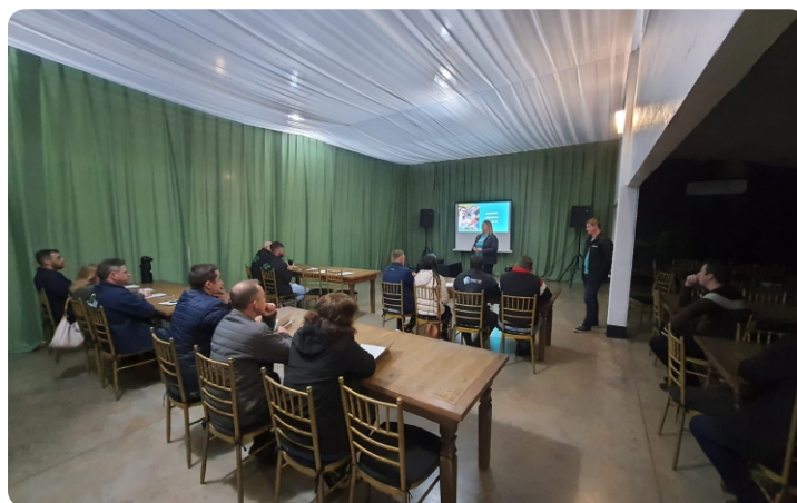
Reuniões estratégicas com profissionais da área de projetos, uma parceria para o Plano Safra 24/25

++++++ ++++++ ++++++ ++++++ ++++++ ++++++ ++++++ ++++++ ++++++ ++++++