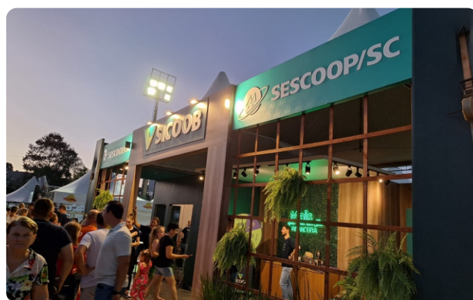
15ª EFACITUS Tunápolis/SC