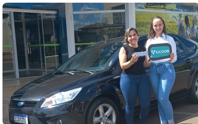
Mais de 646,1 milhões investidos no desenvolvimento dos cooperados, negócios e comunidade.