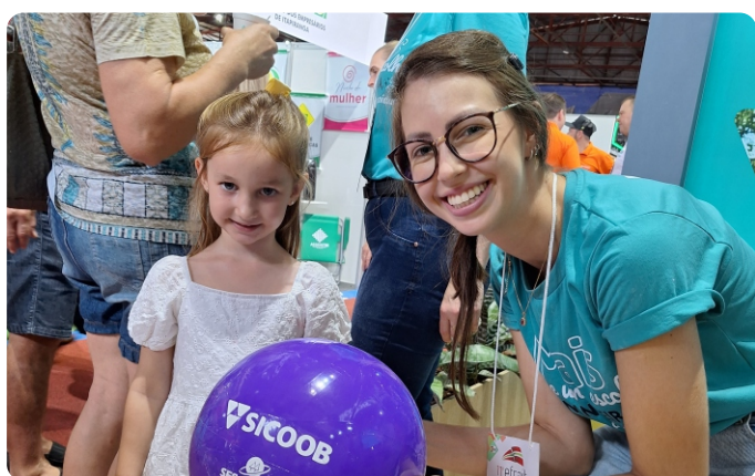
11ª EFRAIT Itapiranga/SC