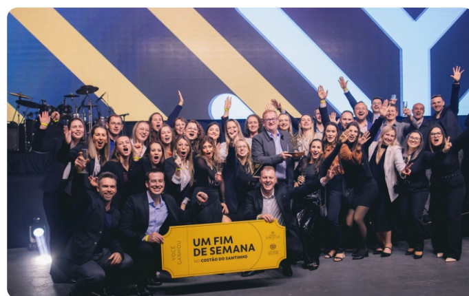
Recebemos o Troféu Excelência Sinergia – 2º lugar – Grupo G3