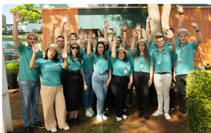
24ª FENASOJA Santa Rosa/RS