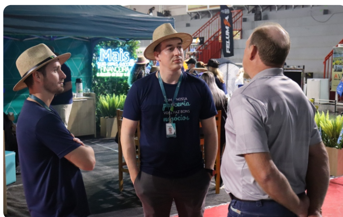
1ª Feira Agro , realizada pela JBS, reunindo produtores da região.