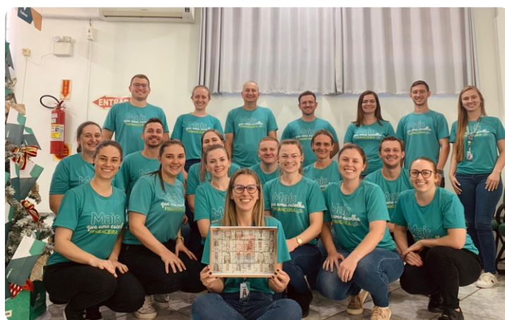
Reconhecimento GPTW – Great Place To Work – As melhores empresas para se trabalhar

++++++ ++++++ ++++++ ++++++ ++++++ ++++++ ++++++ ++++++ ++++++ ++++++