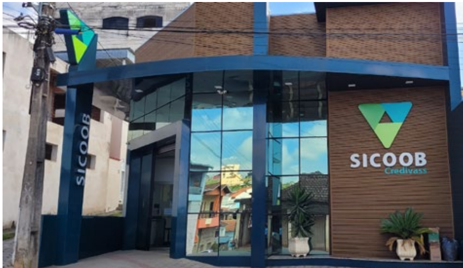
Bom Repouso 19 de Abril 20 anos