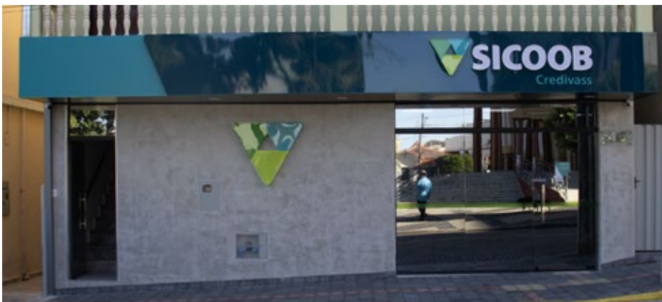
Cachoeira de Minas 06 de Abril 09 anos