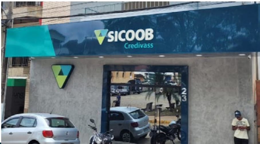
Carmo de Minas 01 de Abril 15 anos