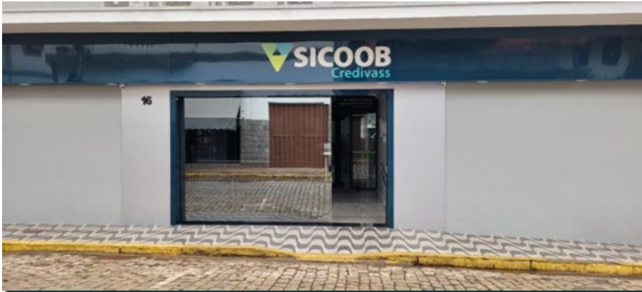
Pedralva 01 de Abril 15 anos