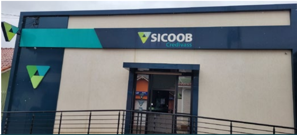
Conceição das Pedras 01 de Abril 15 anos