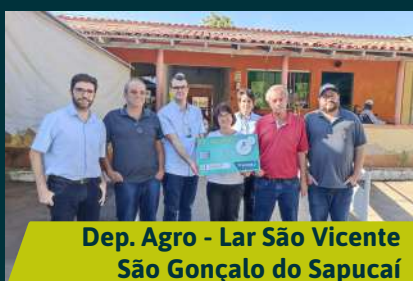
Dep. Agro - Lar São Vicente São Gonçalo do Sapucaí