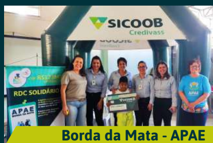
Borda da Mata - APAE