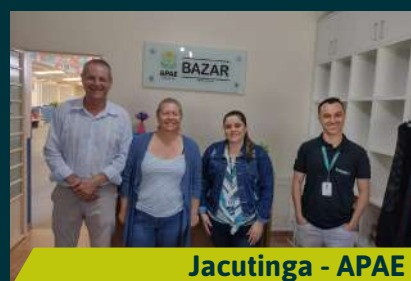
Jacutinga - APAE